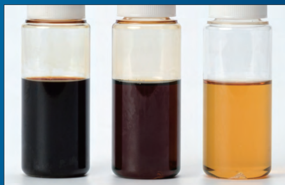
5,000km走行後に、抜き取ったエンジンオイル

愛車に長く乗るための安心メンテナンス。それが、スラッジナイザーによるエンジン内部の洗浄です。そんなに乗らないあなたもエンジン内部のオイルの通り道(以下オイルライン)には日々スラッジ汚れがたまっていきます。原因はエンジンがあたたまりにくい短距離や低速での走行。スラッジ汚れがたまると、しだいにエンジンの動きが妨げられ、エンジン性能が衰えます。定期的にオイル交換をしても、高温で潤滑しているエンジンオイルは劣化とともに不純物を発生させ、汚れとなってオイルラインにたまっていきます。オイルの持つ性能を最大限に発揮させ、大切なお車を快適にお乗りいただくために、年に1回もしくは10,000km毎にスラッジナイザーNV20の施工をおすすめします。