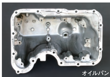
オイルパン 施工例