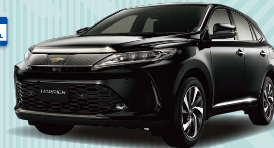
Photo:PROGRESS "Metal and Leather Package" (ターボ2WD 車)、ボディカラーはブラック(202)。