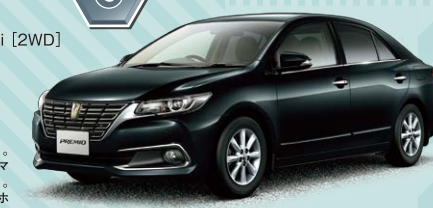
Photo:1.5F"EXパッケージ(2WD)、 ボディカラーはアテッドブラックマ イカ(218)、内装色はブラック。 185/65R15タイヤ&15×6Jアルミホ イールはメーカーオプション。