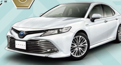
Photo:G"レザーパッケージ"、ボディカラーのアラカネ ワイナルマイカ(089)はメーカーオプション。パレマ ムールーフはメーカーオプション。フライトスボットモ ニター、リフトアップリアシート、インテリジェント リアアシスト(0)やクロストラフィックオートブレーキ機 能付はセットでメーカーオプション。